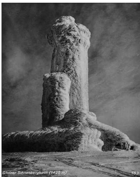
Fot. 1. Obladzona wieża na Śnieżniku (fot. archiwalna)

sudecki Viola lutea subsp. sudetica , pę-pawa wielkokwiatowa Crepis conyzifolia , pięciornik złoty Potentilla aurea , wiele gatunków z rodzaju jastrzębców Hieracium oraz sporadycznie rosnący dzwonek brodaty Campanula barbata . Nieco niżej znajdują się wysokogórskie borówczyska bażynowe Empetro-Vaccinietum (siedlisko przyrodnicze 4060), będące zbiorowiskiem niskich krzewinek występujących w piętrach halnym i kosówki, na bardzo kwaśnych glebach, w miejscach szczególnie eksponowanych na wiatr, ze skąpą okrywą śnieżną. Gatunkami charakterystycznymi są tam bażyna obupłciowa Empetrum hermaphroditum i borówka halna Vaccinium gaultherioides . Sąsiadujące z nimi zbiorowiska borówki czarnej Vaccinium myrtillus są tam zaliczane do związku Piceion abietis . Zbiorowisko jest fizjonomicznie podobne do poprzedniego, lecz znacznie wyższe, z panującą borówką czernicą. Poniżej znajdują się sudeckie zarośla kosówki Pinetum mugo sudeticum , zbiorowisko całkowicie sztuczne, będące efektem nasadzeń prowadzonych na przełomie XIX i XX wieku. Kosodrzewina jest tam gatunkiem obcym, największe jej zgrupowania występują na N, NW i E stokach Śnieżnika i sąsiadują z górnoreglową świerczyną obszaru hercyńsko-sudeckiego Calamagrostio villosae-Piceetum (siedlisko przyrodnicze 9410). To naturalne zbiorowisko boru wysokogórskiego w rezerwacie występuje w piętrze regła górnego, na wysokości około 1185-1320 m n.p.m. Rośnie tu lokalny ekotyp świerka najlepiej przysto-