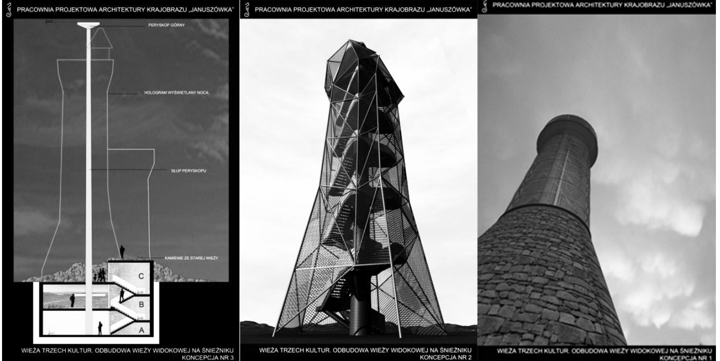
Trzy koncepcje wieży na Śnieżniku z 2013 roku. Opr. Pracownia Projektowa Architektury Krajobrazu „Januszówka” – Bielsko Białą